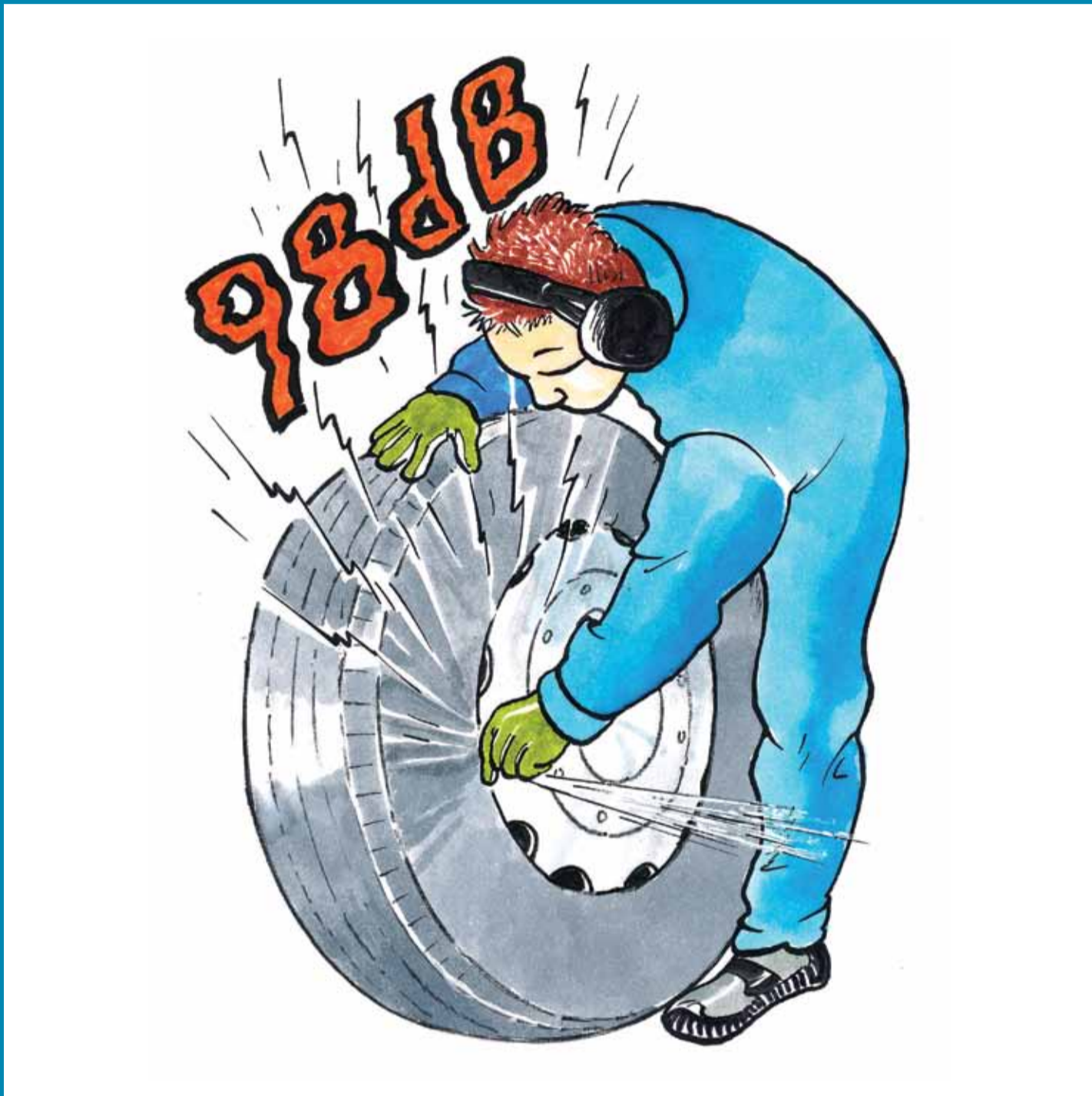
Venttiilin sielun irrotus

Kuulonsuojaimien käyttöraja on 85 dB (desibeliä)