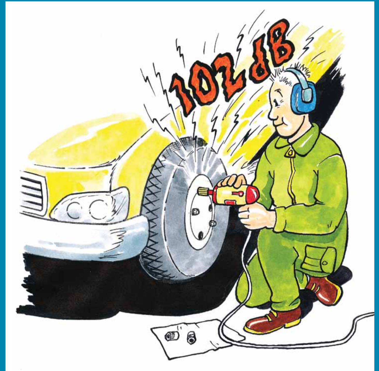
Pyörän irrotus ja asennus